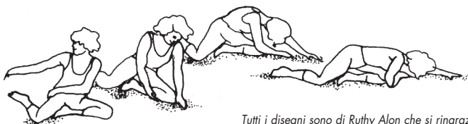
Tutti i disegni sono di Ruthy Alon che si ringrazia

Il programma applicato nel nostro Centro è indicato per chi ha subito un intervento chirurgico o sta tentando di scongiurarlo, per chi soffre da anni di una patologia vertebrale o svolge un'attività che potrebbe portarlo a soffrirne, o per chi semplicemente desidera acquisire la consapevolezza dei suoi movimenti, renderli più armonici e migliorare la sua postura.